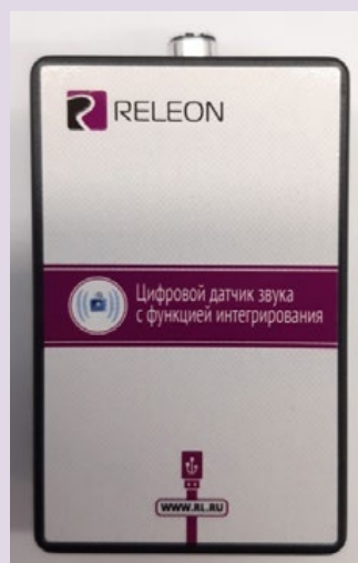
Рис. 7. Датчик звука

Датчик звука — измеряет уровень шумов в окружающей среде и при оценке шумопоглощающих изоляторов. Динамический диапазон: от 30 до 130 дБ. Частотный диапазон: от 50 Гц до 8 кГц. Разрешение: 0,1 дБА (акустические децибелы). Технологические особенности: датчик чувствителен к резким звукам, которые могут дать завышенные результаты измерений.