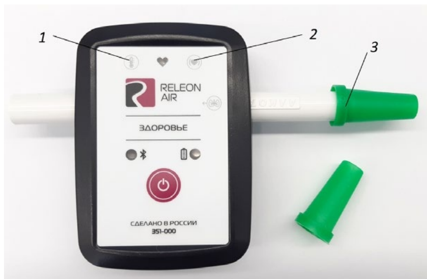
Рис. 3. Мультидатчик по физиологии. Обозначение разъёмов и технологических отверстий: 1 — температура тела, 2 — пульс, 3 — частота дыхания (надет съёмный мундштук)

Мультидатчик по физиологии позволяет определять артериальное давление, пульс, температуру тела, частоту дыхания, ускорение движения (рис 3).