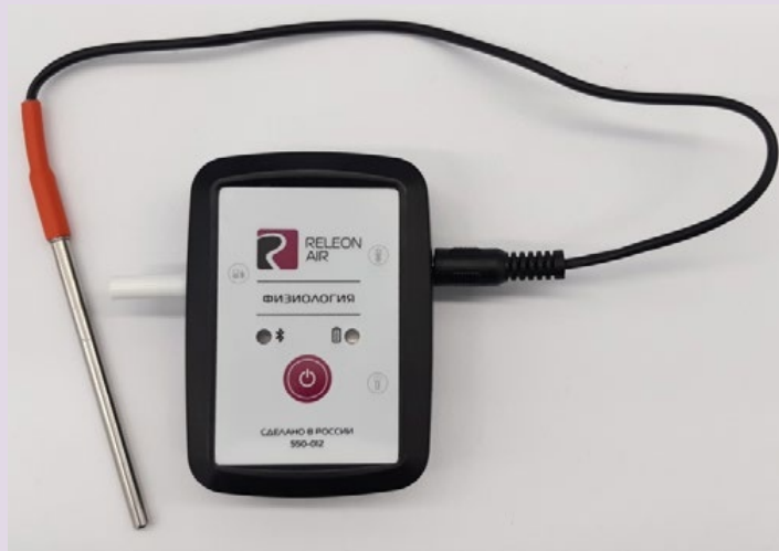
Рис. 12. Датчик температуры тела

Датчик температуры тела — предназначен для непрерывного измерения температуры тела в подмышечной впадине. Оснащён выносным зондом. Диапазон измерения: от 25 до 50 °С. Разрешение датчика: 0,1 °С. Технологическая особенность: для точного измерения в подмышечной впадине должна находиться вся металлическая часть зонда.