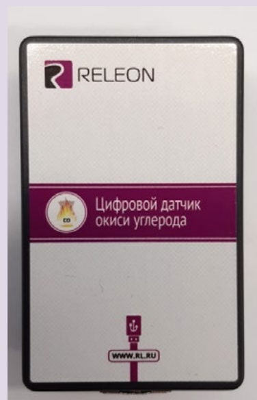
Рис. 11. Датчики кислорода (слева) и угарного газа (справа)