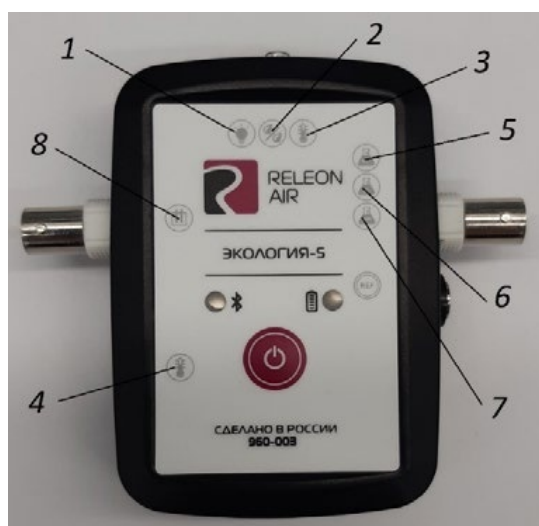
Рис. 2. Мультидатчик по экологии. Обозначение разъёмов и технологических отверстий: 1 — освещённость, 2 — относительная влажность воздуха, 3 — температура окружающей среды, 4 — температура растворов, 5 — нитрат-ионы, 6 — хлорид-ионы, 7 — pH, 8 — электропроводность

Мультидатчик по экологии позволяет измерять следующие показатели: водородный показатель водных сред, концентрации нитрат-ионов и хлорид-ионов, электропроводность, влажность, освещённость, температуру окружающей среды, температуру растворов, растворов и твёрдых тел (рис. 2).