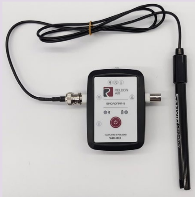
Рис. 5. Датчики электропроводимости

Датчик электропроводимости — предназначен для регистрации и измерения удельной электропроводности жидких сред, в том числе и водных растворов веществ. Применяется при изучении характеристик водных растворов, в том числе почвенных вытяжек.