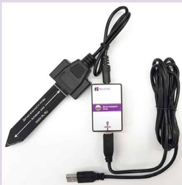
Рис. 4. Датчик влажности почвы

Датчик влажности почвы — предназначен для измерения степени увлажнения почвы, выраженной в процентах. Применяется в агроэкологических и сельскохозяйственных исследованиях.