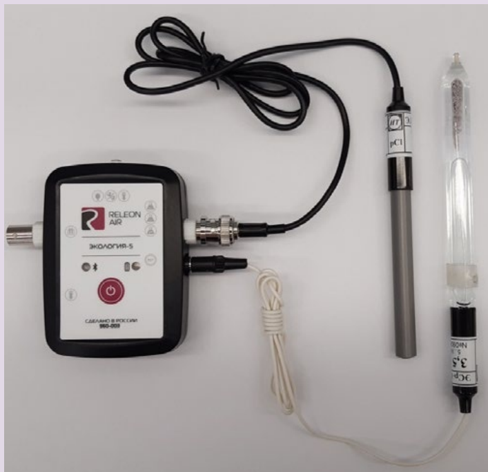
Рис. 10. Ионоселективный датчик (присоединены электро хлорид-ионов и электрод сравнения)

Датчик кислорода — предназначен для определения относительной концентрации кислорода в воздухе. Диапазон измерения: от 0 до 100 %. Разрешение: 0,1 %. Технологические особенности: при измерении содержания газа в выдыхаемом воздухе необходимо держать мембрану максимально близко ко рту; восстановление показаний на воздухе происходит через 1—2 минуты (время диффузии через мембрану).