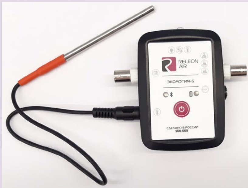
Рис. 6. Датчик температуры растворов

Датчик температуры термопарный предназначен для измерения температур до 900. Используется при выполнении работ, связанных с измерением температур плавления и разложения веществ, а также для измерения температуры в экзотермических процессах.