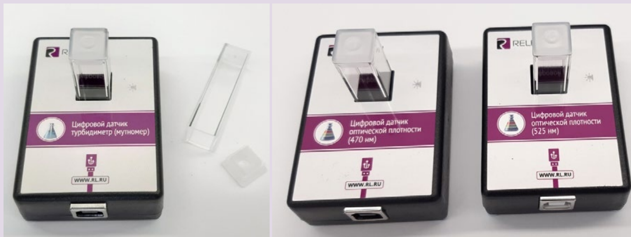
Рис. 8. Датчики мутности (слева), оптической плотности на 465 нм (в центре) и 525 нм (справа)

В комплект входят датчики с различной длиной волн полупроводниковых источников света: 465 и 525 нм. Диапазон измерения коэффициента пропускания света: от 0 до 100 %. Разрешение при измерении коэффициента пропускания: 0,1 %. Диапазон измерения оптической плотности: от 0 до 2 D. Разрешение при измерении оптической плотности: 0,01 D. Длина оптического пути кюветы: 10 мм. Объём кюветы: 4 мл. Технологические особенности: требуется хорошо промывать кювету для исследуемого раствора.