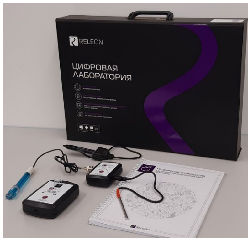
Рис. 1. Цифровая лаборатория

Ниже дана краткая характеристика цифровых датчиков, приведены выявленные на практике технологические особенности применения. Учёт этих особенностей позволит правильно использовать датчики и продлить срок их службы.