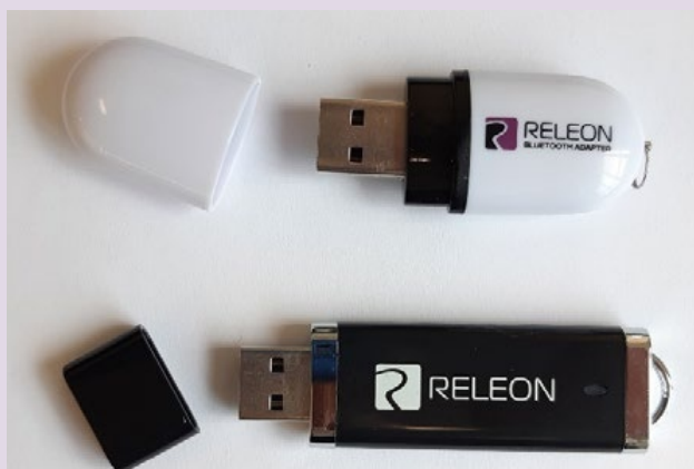
Рис. 13. Общий вид USB-флеш-накопителя (внизу) и Bluetooth-адаптера (вверху) Releon

В комплекте цифровой лаборатории Releon поставляется программное обеспечение Releon Lite на USB-флеш-накопителе, а также Bluetooth-адаптер для связи регистратора данных с беспроводными датчиками (рис. 13).